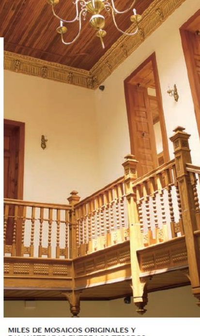
MILES DE MOSAICOS ORIGINALES Y BALAUSTRADAS ENTRE LOS TESOROS ARTÍSTICOS DE LA CASA RIVAS MERCADO EN LA CIUDAD DE MÉXICO.